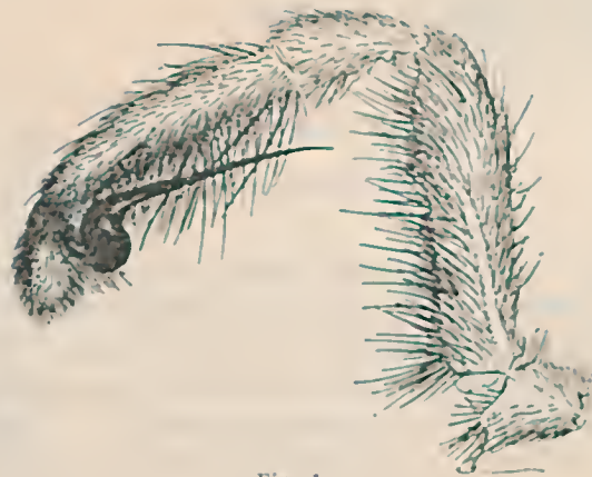
Fig. 1 Trechona uniformis , sp. n. Palpo do ♂.

Cephalothorace — 13,5 \times 11,5 mm. Abdome — 12 \times 6,5 mm. Fiandeiras posteriores — 3,5 + 2,5 + 3,5 = 9,5 mm. Palpos — 8 + 3,5 + 7 + 2,5 = 21 mm. Bulbo do palpo — 6,5 mm.